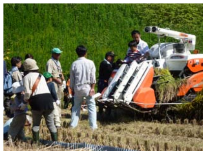
コンバイン運転体験