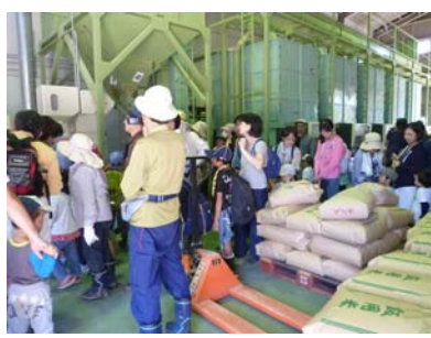
ライスセンター見学